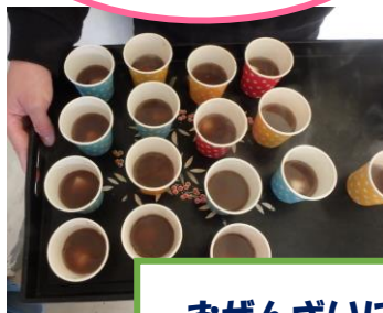
おぜんざいにして いただきました！